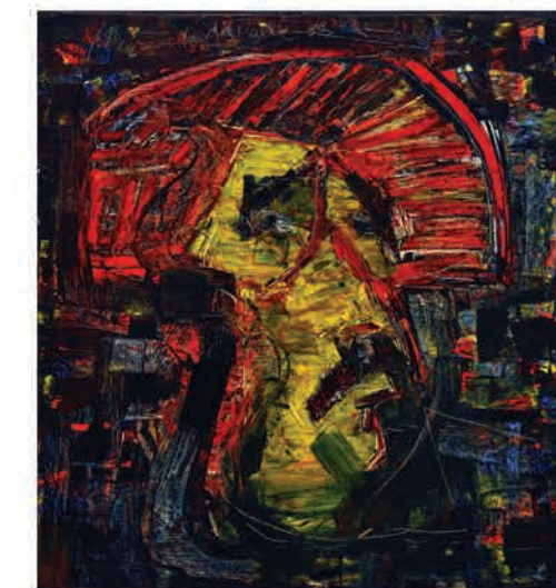
Julio Rosado del Valle. Autorretrato , 1980 Óleo sobre masonite. 50 3/8" x 47 1/4"

El trabajo de Julio Rosado del Valle ha sido exhibido en el MAB, pero no habíamos tenido el honor de poder ser custodios permanentes de su obra. En marzo de 2022, la Colección Reyes-Veray nos ofrece en donación un (1)