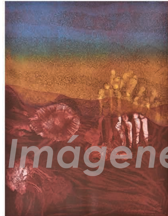
María Emilia Somoza. Renacer , 2005 Aguafuerte. 26" x 19 3/4"

Los pasados años han sido cruciales para establecer los cimientos del MAB como espacio cultural sólido que presenta parte de la historia del arte puertorriqueño y que sirve como pieza clave para conocer, atesorar y difundir este patrimonio. Para celebrar ambos eventos, abrimos al público una muestra especial conformada únicamente por una selección de piezas que han sido recientemente donadas al Museo.