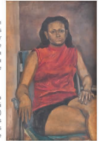
Rubén Rivera Aponte. Retrato de una joven (Tatita) , 1969 Óleo sobre masonite, 35" x 23"

autorretrato de 1980 de Rosado del Valle, el mismo que había sido expuesto en 2012 como parte de las exhibiciones de reapertura del Museo. Es grato volver a recibir esta pieza, presentarla ahora como parte de nuestro acervo permanente y de vez, recordar el centenario del artista.