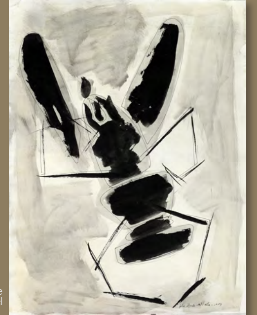
Langosta (1958) Julio Rosado del Valle Gouache sobre papel 18 6/16" x 24"