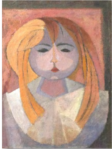
Carmencita (1958) Julio Rosado del Valle Oleo sobre lienzo 32" x 40"

El Museo de Arte de Bayamón (MAB) tiene el gran honor de presentar la exhibición Fuerza Expresiva de Julio Rosado del Valle, uno de los maestros más destacados de las artes plásticas puertorriqueñas y figura evidente en el ámbito de las artes latinoamericanas.