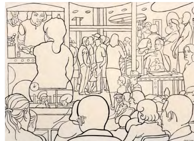
Sin título (1960) Carlos Raquel Rivera Tinta sobre papel 9.5" x 13"