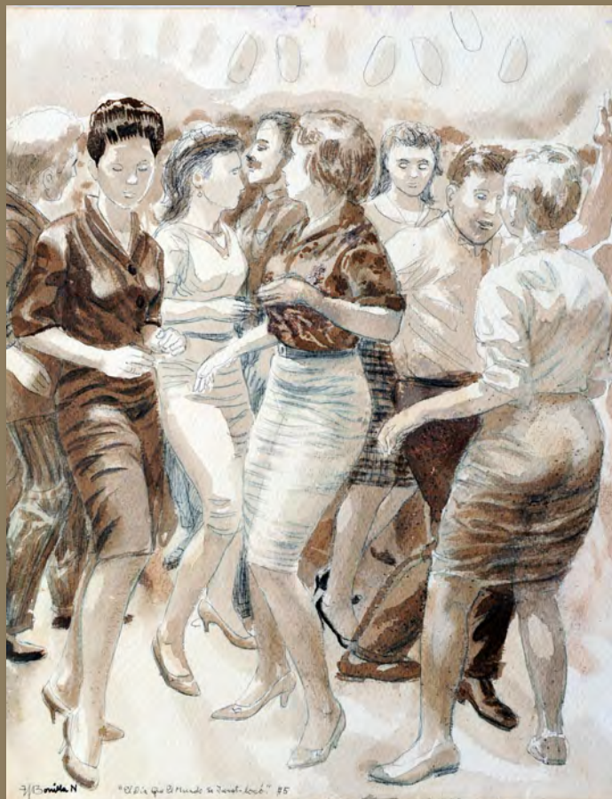
El día en que el mundo se Twist-locó (1978) Félix Bonilla Norat Medio mixto sobre papel 20" x 15 3/4"