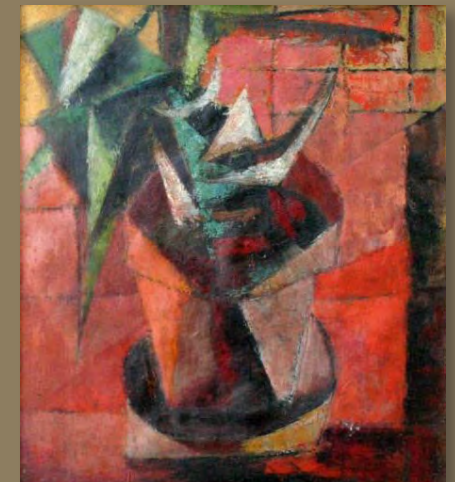
Tiesto (1950) Julio Rosado del Valle Oleo sobre lienzo 16" x 14"