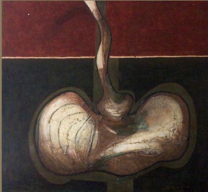
Semilla (1977) Julio Rosado del Valle Oleo sobre masonite 48" x 51"

Esta exposición es parte del compromiso del MAB con la obra del maestro Julio Rosado del Valle y el deseo de presentar lo mejor de las artes plásticas puertorriqueñas. Es nuestra finalidad el fomentar su difusión, permitir el disfrute y educar al mayor número de visitantes.