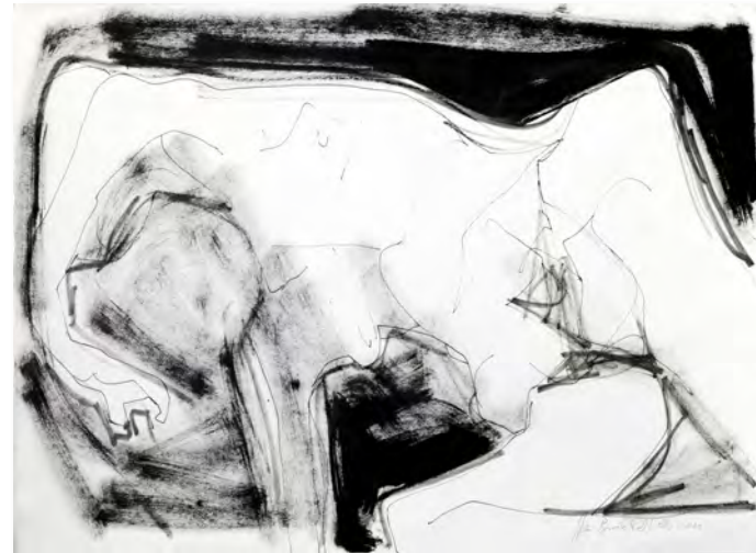
Mujer acostada (1965) Julio Rosado del Valle Medio mixto: gouache y tinta sobre papel 22 1/2" x 30"