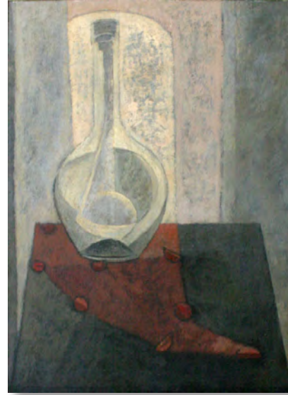
Naturaleza muerta (1958) Julio Rosado del Valle Oleo sobre lienzo 32" x 22"